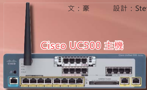
Cisco UC500 主機

集多功能於一身的UC500 為企業內聯網提供8個 10/100Base 網絡接口(包括PoE)(最多支持48個用戶)、1 x WLAN 及4條模擬式電話插頭可連接傳真機或普通電話，而對外支持1 x WAN 及4 x FXO (4條街線接入)或增加一張T1 卡作擴充至27條街線。整套UC500 除了完全取代電話系統如PABX外，更可以為每位用戶的語音留言，轉化為一個可以於電腦播放之語音檔，以電郵方式送到用戶電腦，就算身處外地同樣可以收聽語音留言。